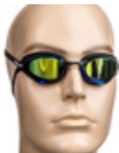
DELFINA RECORD GREEN MAGIC Art nr: MM-8503