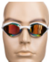
DELFINA RECORD COLOR MAGIC WHITE Art nr: MM-8505