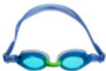
DELFINA JOY KID BLUE Art nr: CF-2005

Foregående briller/bilder leveres med fire forskjellige nesejusteringer