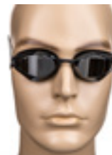
DELFINA RECORD MIRROR MAGIC Art nr: MM-8502