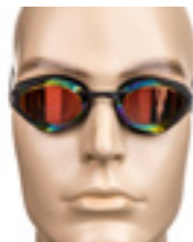
DELFINA RECORD COLOR MAGIC BLACK Art nr: MM-8501